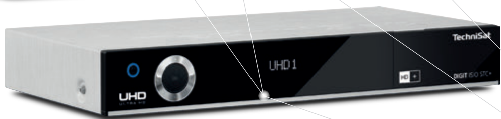
DIGIT ISIO STC+