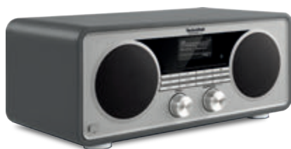
Multiroom-Soundsystem DIGITRADIO 600

Mal schnell vom Lieblingsfilm zur Lieblingsmusik wechseln? Mit TechniSat CONNECT kein Problem. Per Wischgeste spielen Sie ab sofort Ihre Musik einzeln in jedem Raum oder in vielen Räumen gleichzeitig ab. Komplett ohne Kabel, drahtlos über das Heimnetzwerk. Dank des neuen TechniSat CONNECTED AUDIO SYSTEMS lassen sich intelligente Multiroom-Lösungen mit Audio-Streaming realisieren, die zentral steuerbar über die TechniSat CONNECT App sind.