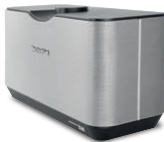
Multiroom-Soundsystem AUDIOMASTER MR3